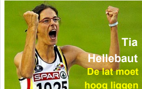
Tia Hellebaut De lat moet hooq llaqen